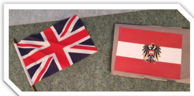
englische und österreichische Fahne