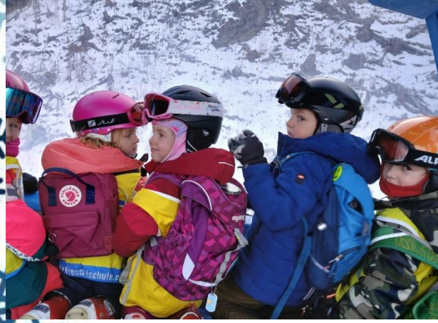
Beim Gondel fahren haben wir unsere Adleraugen ausgepackt. Manchmal sahen wir nämlich Steinböcke die auf Futtersuche waren.